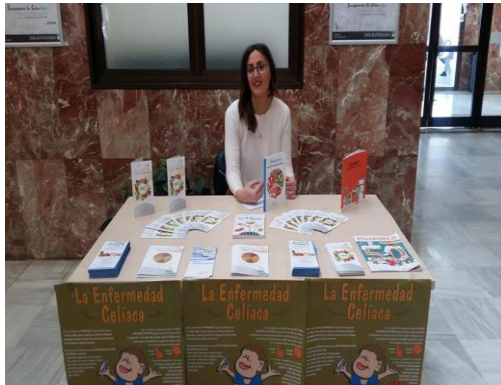
Hospital Infanta Cristina (Badajoz)