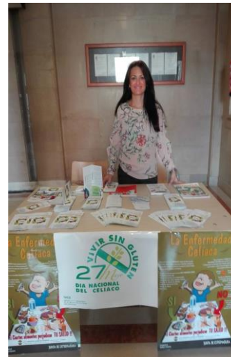
Hospital Perpetuo Socorro (Badajoz)