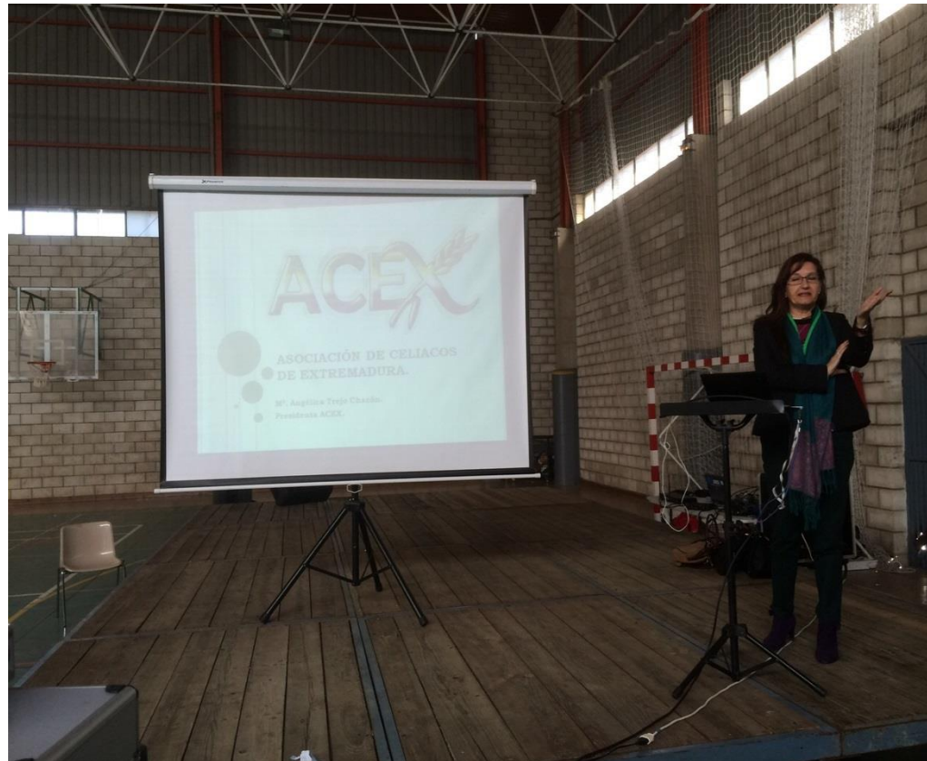
Charla sobre la enfermedad celiaca y dieta sin gluten