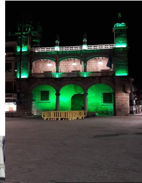
Ayuntamiento Plasencia (Cáceres)