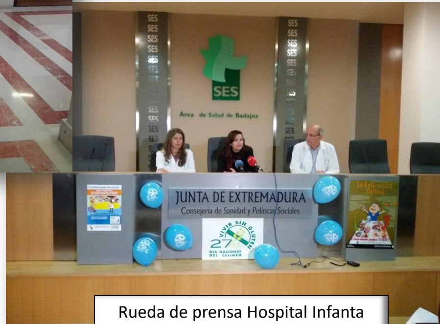
Rueda de prensa Hospital Infanta Cristina