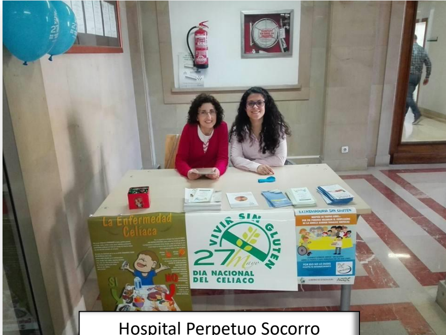
Hospital Perpetuo Socorro