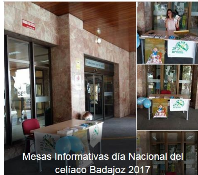
Mesas Informativas día Nacional del celíaco Badajoz 2017