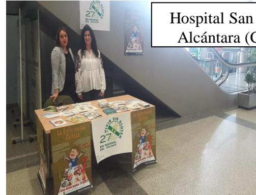
Hospital San Pedro de Alcántara (Cáceres)